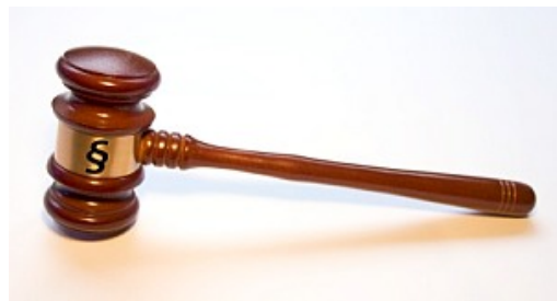
Richterhammer: Justizfälle und ihre Wahrnehmung kommen ins Visier der PR

München (pte/27.07.2010/12:45) - Juristisch im Recht bleiben und gleichzeitig das Gesicht wahren ist in Zeiten von Web 2.0 eine immer schwierigere Aufgabe. Die "Litigation-PR" stellt sich als eigenständige Disziplin der Herausforderung, juristische Auseinandersetzungen gezielt zu kommunizieren. Im September behandelt eine Fachtagung an der Macromedia Hochschule für Medien und Kommunikation (MHMK) http://www.mhmk.de/litigation diesen neuen Trend, der an der Schnittstelle zwischen Journalismus, PR und Recht agiert.